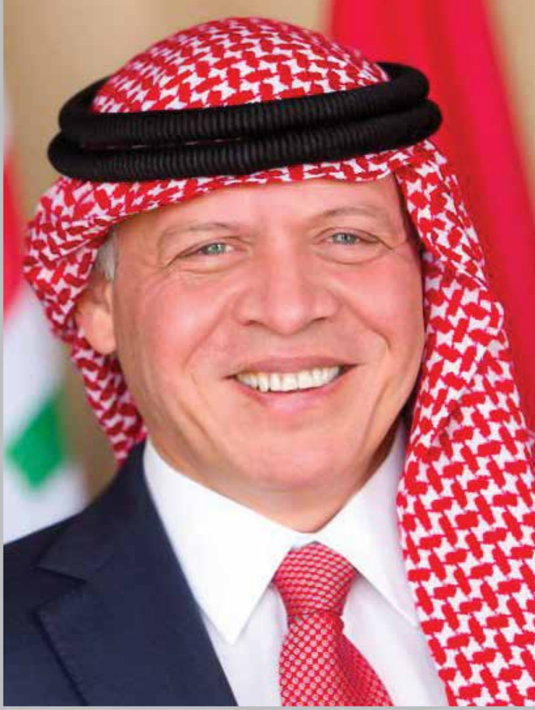
حضرة صاحب الجلالة الملك عبد الله الثاني ابن الحسين