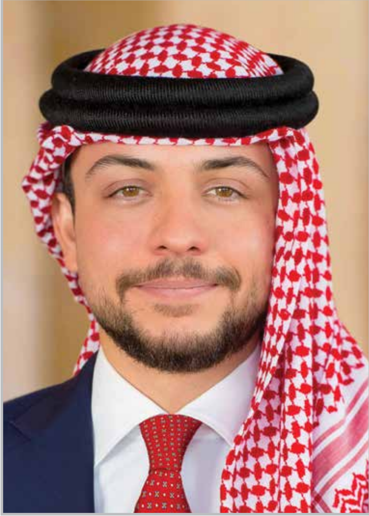
حضرة صاحب السمو الملكي الأمير حسين بن عبد الله الثاني ولي العهد